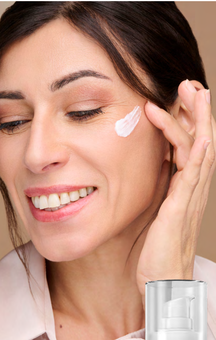
Correction Nuit MEDICEUTICS® Flacon pompe airless 50 mL, 86€